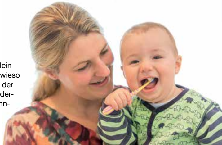
Der spielerische Einstieg in die Zahnpflege

Es ist ein Ammenmärchen, dass Milchzähne bei Babys und Kleinkindern nicht so gut gepflegt werden müssten, weil sie ja sowieso ausfallen. Experten sind sich einig, dass auch die Zähnchen der Kleinen täglich gereinigt werden sollten – am besten mit einer Kinderzahnbürste mit weichen Borsten und etwas fluoridierter Kinderzahn-pasta. Am einfachsten gelingt das, wenn das Kind bereits früh durch feste Rituale ans Zähneputzen gewöhnt wird. In den ersten Lebensjahren putzen Vater oder Mutter. Spätestens ab dem dritten Lebensjahr wird empfohlen, das Kind selbst die Pflege übernehmen zu lassen – nach intensivem Üben unter Aufsicht natürlich, denn so einfach ist die gründliche Pflege für das Kind nicht. Hier unterstützen Bilderbücher und CDs mit Zahnputzliedern. Darüber hinaus empfehlen Zahnärzte, dass Eltern den Putzerfolg bis in die Schulzeit hinein kontrollieren und – wenn nötig – nachputzen.